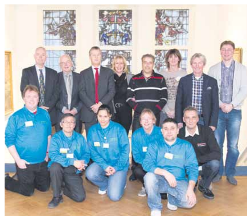
Een trots team van Paswerk en De Spiegel in het Heemstedse raadhuis

Paswerk Schoonmaak is gestart met de nieuwe schoonmaakopdracht van de gemeente Heemstede. Binnen de opdracht vallen het complete raadhuis (kantoren, vergaderruimten, raadzaal en overige ruimten),