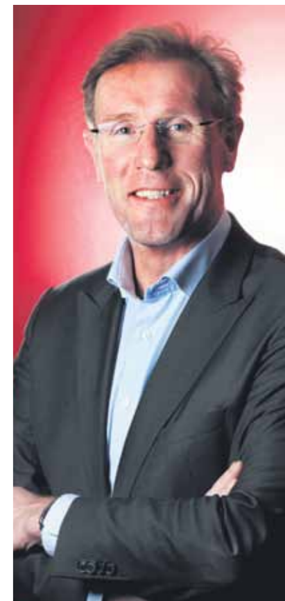
Hans van Breukelen

Voor meer info: kijk op www.gaeensvreemd.nl of mail naar: info@gaeensvreemd.nl