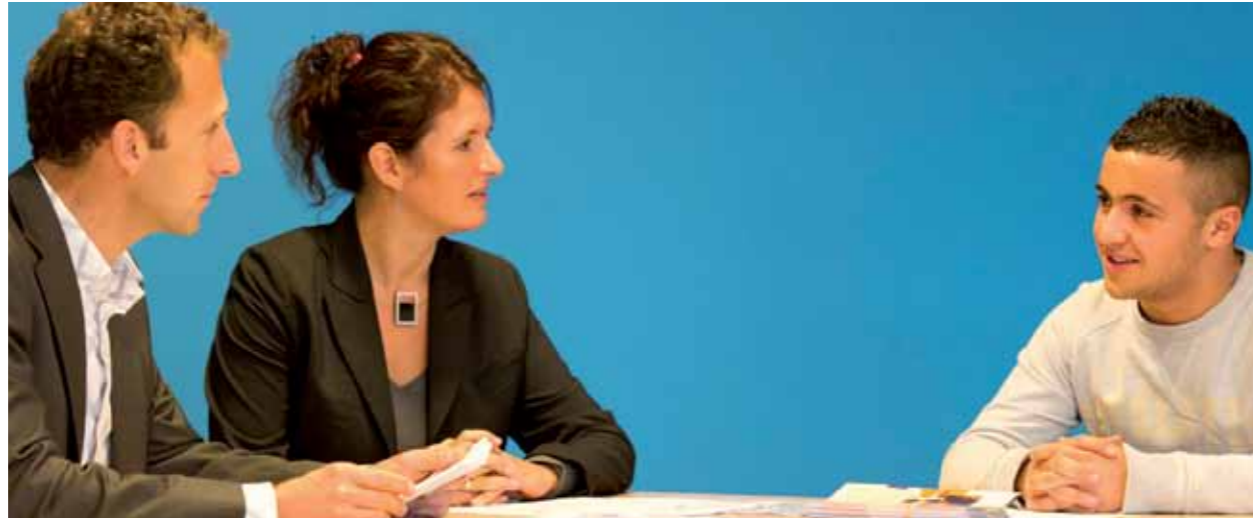
"We mochten de geheime kamer binnen! Het leek net CSI... Achter het grote hek stonden allemaal kluisen. De goudstaven hebben we niet gezien, maar het was wel super gaaf!" Leerling op Bliksemstage bij Van Lanschot

JINC JINC helpt jongeren uit achterstandswijken op weg naar een goede start op de arbeidsmarkt. Veel van hen groeien op met minder voorbeelden en rolmodellen om zich aan op te trekken. Ze vinden het lastig een juiste studiekeuze te maken of slagen er niet in hun stage af te ronden. Door beroepsoriëntatie op de werkvloer, het aanleren van (sociale) vaardigheden en workshops over ondernemerschap laat JINC jongeren (8 tot 16 jaar) kennismaken met het bedrijfsleven. Met de projecten worden jaarlijks ruim 24.000 leerlingen van de basisschool en het vmbo bereikt. Het doel: een juiste studiekeuze, minder kans op schooluitval en beter zicht op werk. Naast Haarlem en Haarlemmermeer is JINC actief in Amsterdam, Utrecht en Rotterdam. Haarlem / Haarlemmermeer. In Haarlem worden de projecten Bliksemstage en Sollicitatietraining aangeboden aan leerlingen die opgroeien in de Slachthuisbuurt, het Rozenprieel, Parkwijk en de Boerhaavewijk. In de Haarlemmermeer is JINC gestart in de Hoofddorpse wijken Graan voor Visch en Bornholm-Overbos.