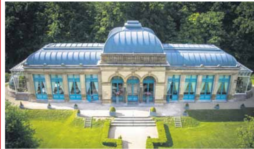
Er kan er maar één "het pareltje van Nederland" zijn..

Hieronder een overzicht van een aantal unieke locaties in deze regio.