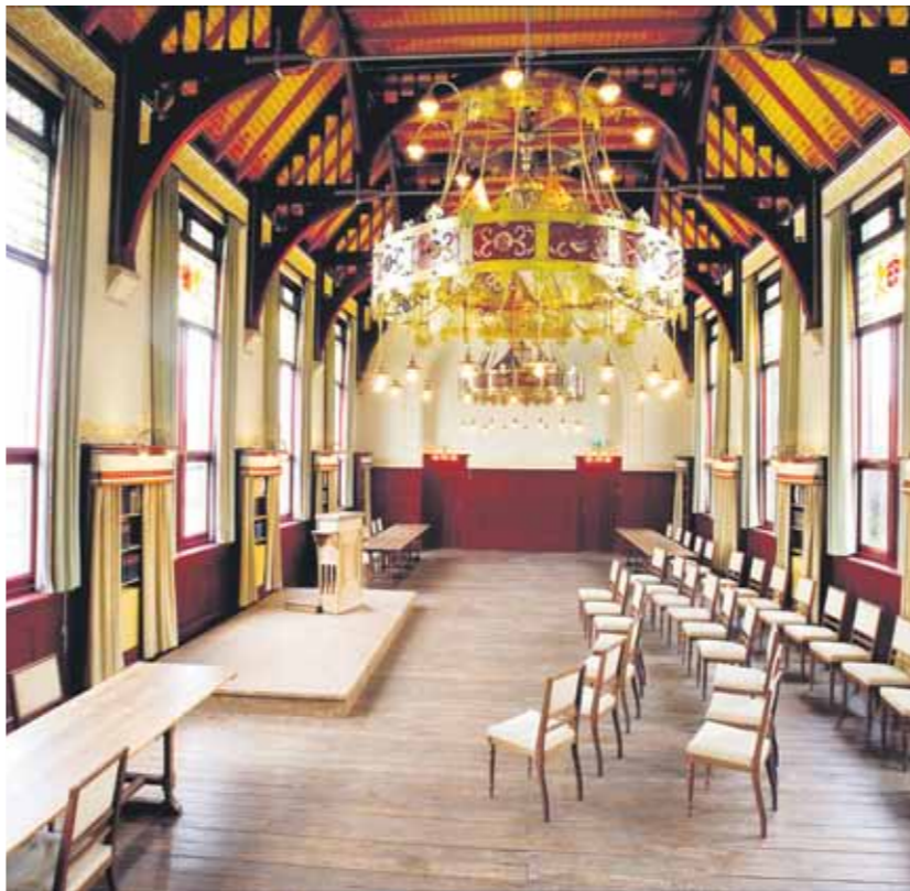
Het Hodshon huis aan het Spaarne

Ook zijn er een aantal locaties met een capaciteit tot circa 1500 personen. De zakelijke markt is een groeimarkt. Daarom is het één van de speerpunten van onze organisatie. Wij ontwikkelen diverse online- en offline activiteiten, zijn aanwezig op beurzen en organiseren netwerkbijeenkomsten. In april hebben we een