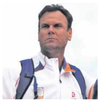
Robert Eenhoorn