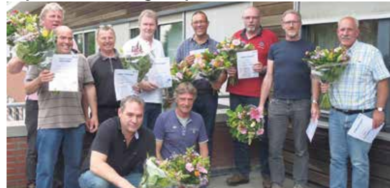
Certificaten en bloemen voor de Paswerk teamleiders.

Elf teamleiders binnen de Paswerk bedrijven hebben een certificaat mbo-niveau 3 behaald. Zij hebben een tweejarig traject Beroeps Begeleidende Leerweg (BBL) gevolgd, dus werken en leren tegelijk. Deze vorm van kennis en werkervaring benutten om de beroepscompetenties te versterken is een belangrijke taak van Paswerk. Paswerk is de sociale onderneming van de vijf gemeenten in de regio Zuid- Kennemerland. De opdracht is om mensen die op eigen kracht niet zo gemakkelijk een passende job bij een reguliere werkgever kunnen vinden te helpen met werkervaring, opleiding en be-