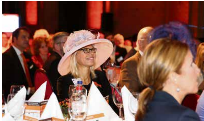
Haarlemse Prinsjesdag Lunch 2015.

Hoewel het evenement pas voor de derde keer wordt georganiseerd, heeft de Haarlemse Prinsjesdaglunch een vaste plek op de ondernemersagenda veroverd. De bijeenkomst op de derde dinsdag van september, waarop met name middelgrote en grote bedrijven uit Haarlem goed vertegenwoordigd zijn, heeft zich razendsnel ontwikkeld tot een stijlvol, zakelijk evenement.